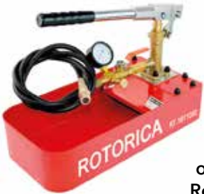
Ручной опрессовщик Rotor Test ECO

Для гидравлического испытания систем отопления на герметичность давлением до 50 бар. Стальной корпус 7 литров. Производство: ROTORICA Артикул: RT.1611050