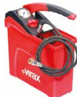
Ручной опрессовщик VIRAX 10 л, 100 бар

Испытательный насос с пластиковым резервуаром для воды 10 л, максимальное проверочное давление 50 бар. Производство: VIRAX (Франция) Артикул: 262015