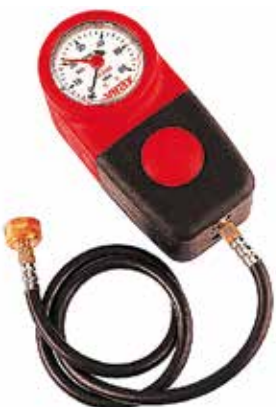
Прибор контроля газонепроницаемости Virax

Испытательный насос с пластиковым резервуаром для воды 10 л, максимальное проверочное давление 100 бар. Производство: VIRAX (Франция) Артикул: 262005