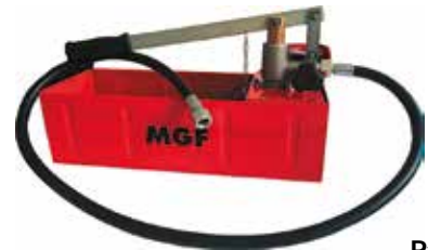
Ручной опрессовщик MGF

Испытательный насос для проверки на герметичность давлением до 60 бар, стальной корпус 12 литров. Производство: ROTORICA Артикул: RT.1611060