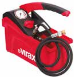
Ручной опрессовщик VIRAX 5 л, 50 бар

Высоконапорный насос для проверки систем отопления на герметичность давлением до 40 бар. Расход воды 6 л/мин. Производство: VIRAX (Франция) Артикул: 262070