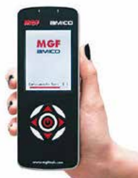
Многофункциональный прибор MGF Amico для измерений и поиска утечек

Компактный прибор для проверки герметичности газовых систем при давлении менее 50 мбар. Автоматический ограничитель давления позволяет избежать любых ошибок. Размеры в мм: 165 x 80 x 80. Вес: 1,28 кг. Производство: VIRAX (Франция) Артикул: 262080