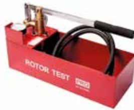
Ручной опрессовщик Rotor Test PRO

Для гидравлического испытания систем отопления на герметичность давлением до 50 бар. Стальной корпус 7 литров. Производство: ROTORICA Артикул: RT.1611050