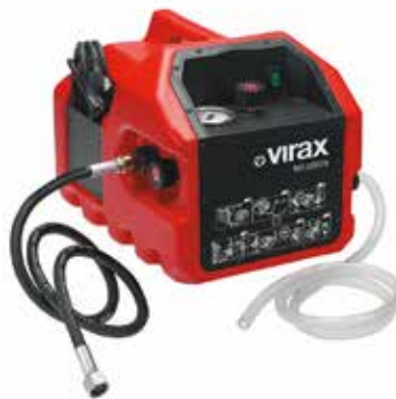
Электрический опрессовщик VIRAX RP PRO 3

Компактный и легкий при переноске. Опрессовщик для тестирования сантехнических и отопительных систем, испытывает их на герметичность давлением до 60 бар. Расход до 7 л/мин. Производство: MGF (Италия) Артикул: 905200