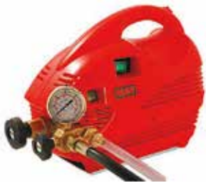
Электрический опрессовщик MGF Compact 60 Electro

Стальной корпус, давление до 60 бар, производительность 11 мл/такт, емкость 12 л, шланг 1,5 м, вес 7,7 кг. Производство: MGF (Италия) Артикул: 904300