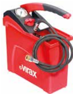
Ручной опрессовщик VIRAX 10 л, 50 бар

Испытательный насос с пластиковым резервуаром для воды 10 л, максимальное проверочное давление 50 бар. Производство: VIRAX (Франция) Артикул: 262035